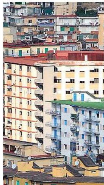
Edilizia in crisi anche per la stretta nella concessione di mutui

fuorvianti perché basati spesso su un mix di prodotti che può essere molto diverso». «Infine, non si deve dimenticare che la causa di questa situazione sta nella mancanza di liquidità e nella diffidenza registrabile su scala internazionale: le banche italiane devono finanziarsi, e per loro le condizioni non sono certo quelle riservate agli istituti olandesi, tedeschi o svedesi», conclude il dirigente. (pgp)